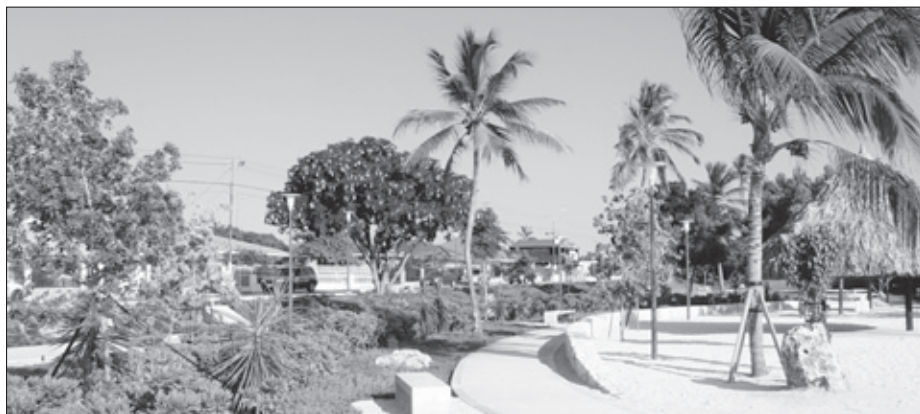
In februari vorig jaar werd de eerste fase van het masterplan voor de ontwikkeling van Marie Pampoen afgerond.

In februari vorig jaar werd het strand en de parkeerplaats aan de westkant van de kuststrook van een kilometer al aangelegd en gerenoveerd. Het totale project kost rond de 10 miljoen gulden. Wat fase twee betreft gaat het om een bedrag van 4 miljoen.