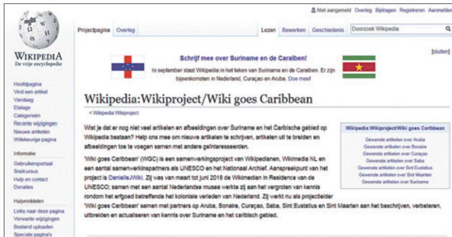
De pagina waarop de schrijfmaand wordt aangekondigd.

De projectleider legt over zichzelf uit: „Ik ben sinds 1 augustus de projectleider van het project Wiki goes Caribbean (WGC) bij Wikimedia NL. Met dit project proberen we de informatie over Suriname en het Caribisch gebied op Wikimedia-projecten (Wikipedia, Commons, Wikidata en Wikisource) te vergroten, uit te breiden, te verbeteren en te actualiseren. Binnenkort organiseren we een schrijfperiode 'Suriname